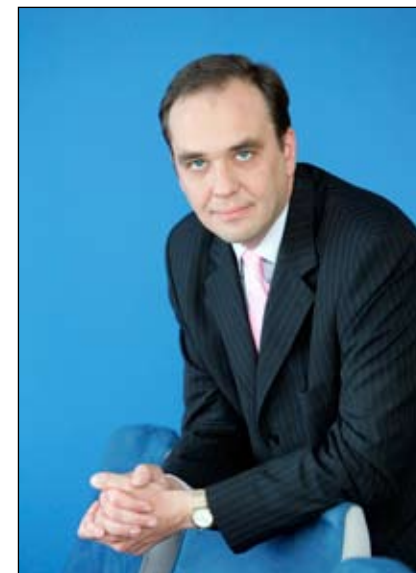
Mindaugas Šalčius Valstybinės draudimo priežiūros komisijos pirmininkas. 2010 m.