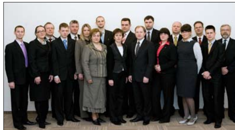
AAS „Gjensidige Baltic“ Lietuvos filialo departamentų ir skyrių vadovai. 2010 m.