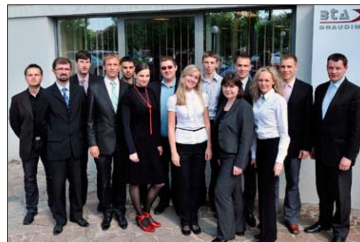
„BTA DRAUDIMO“ specialistai. 2010 m.